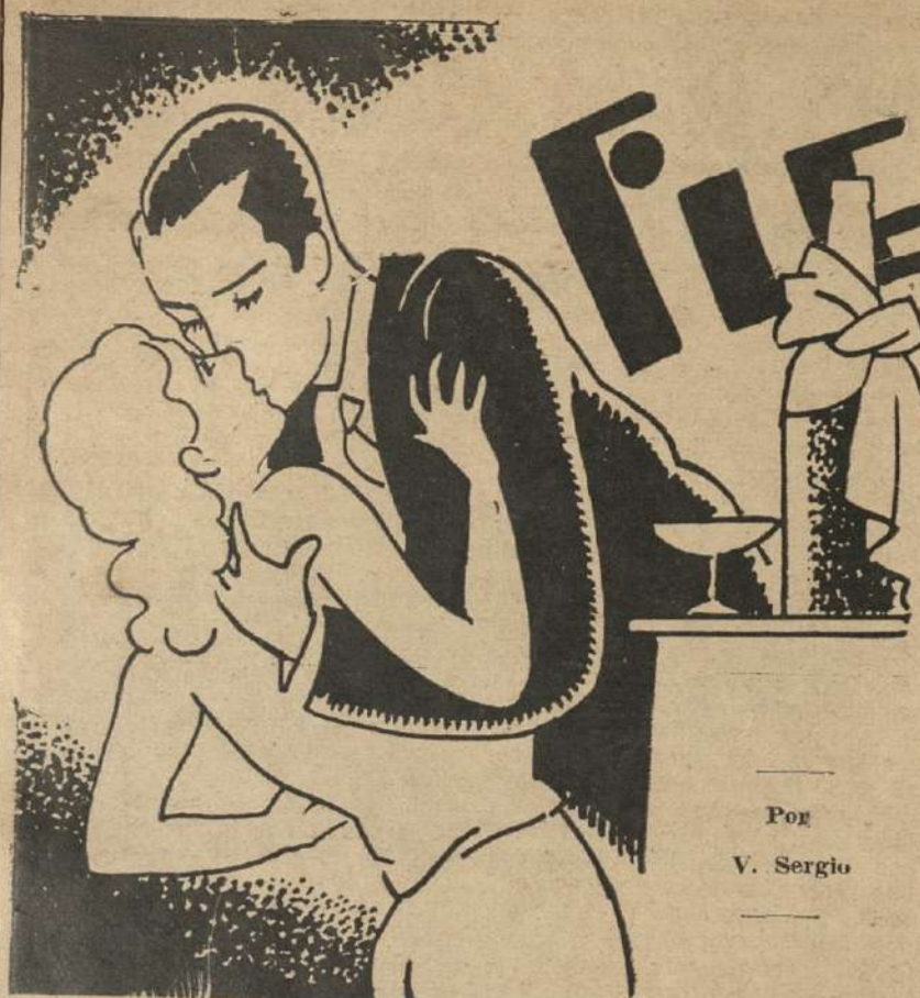
Por V. Sergio

No Juan; tanto champagne, no. Me asusta la espuma traidora. Me intimidada. Y no es de ahora... ¿Olvidas la pobreza de mis primeros años? Hablar entonces del champagne era para mí como invocar lo inaccesible, lo prohibido. "La perdí el lujo, el champagne". Así o por primera vez, siendo muy chica, decir a mi madre de una amiga suya, muy hermosa, que nos visitaba de tanto en tanto y dejaba siempre en nuestro modesto departamento una estela de sutil perfume, un halo de mundo misterioso y desconocido. Desde ese momento, para mí racionario infantil, champagne fué sinónimo de pérdida.