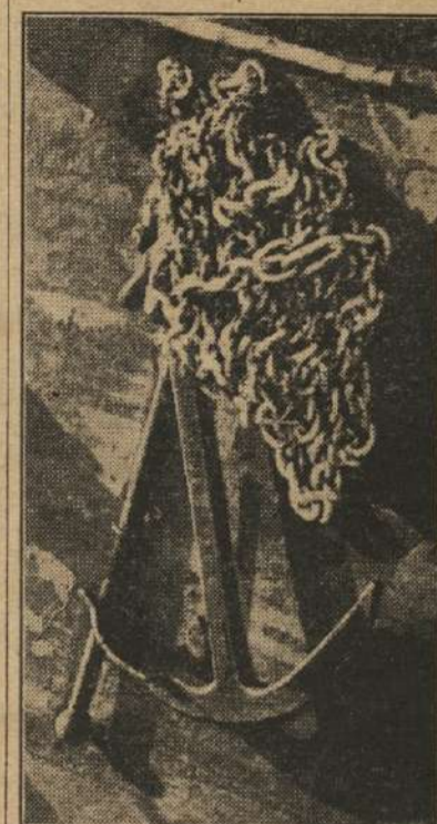
¿Cómo puede una cadena mohosa y un ancla vieja revelar belleza alguna?

colores sobre el objetivo o merced a un disco de difusión. También se mejora de varios modos en el proceso de copiar o ampliar, aumentando o disminuyendo la claridad de