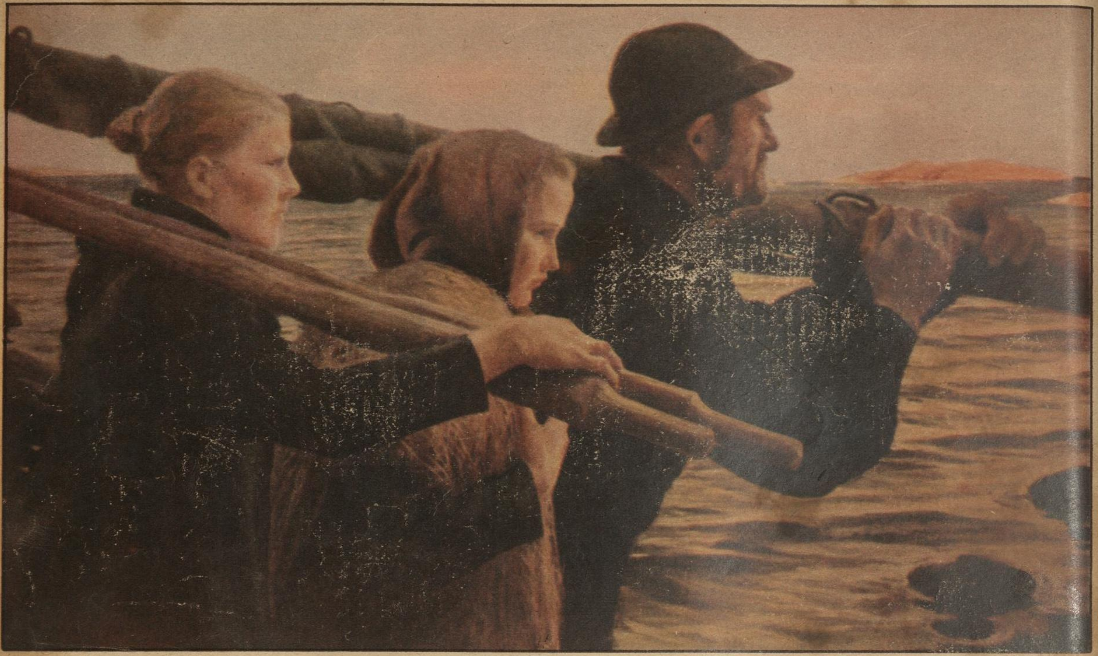
DESPUES DE LA PESCA, por Albert Edelfet.