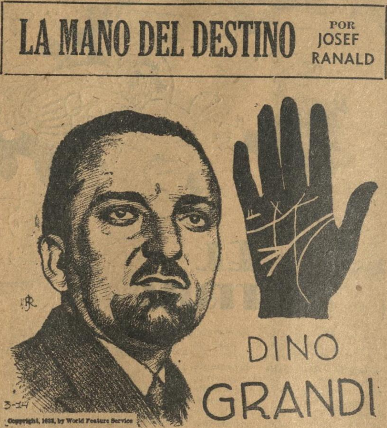
LA MANO DEL DESTINO POR JOSEF RANALD

ADIVINANZA De arena un grano puede pararme, mas a quien sigo no hay quien lo pare, ni en el cielo, ni en la tierra, ni en el agua, ni en el aire. (Sol—dado.)