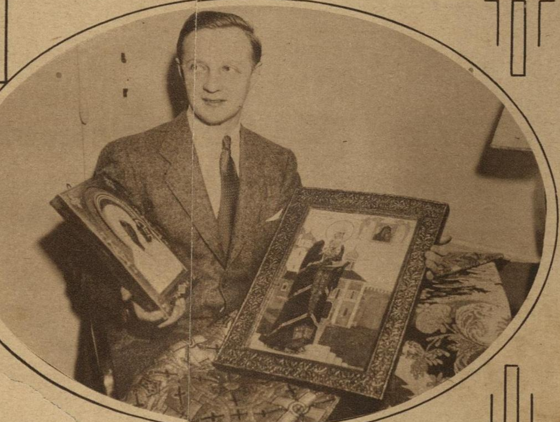
PRINCIPE RUSO CONFERENCIANTE: Miguel Alexandrovitch Goundoroff, recientemente llegado a los Estados Unidos para dar conferencias sobre los tesoros artísticos acumulados por la familia imperial de Rusia.