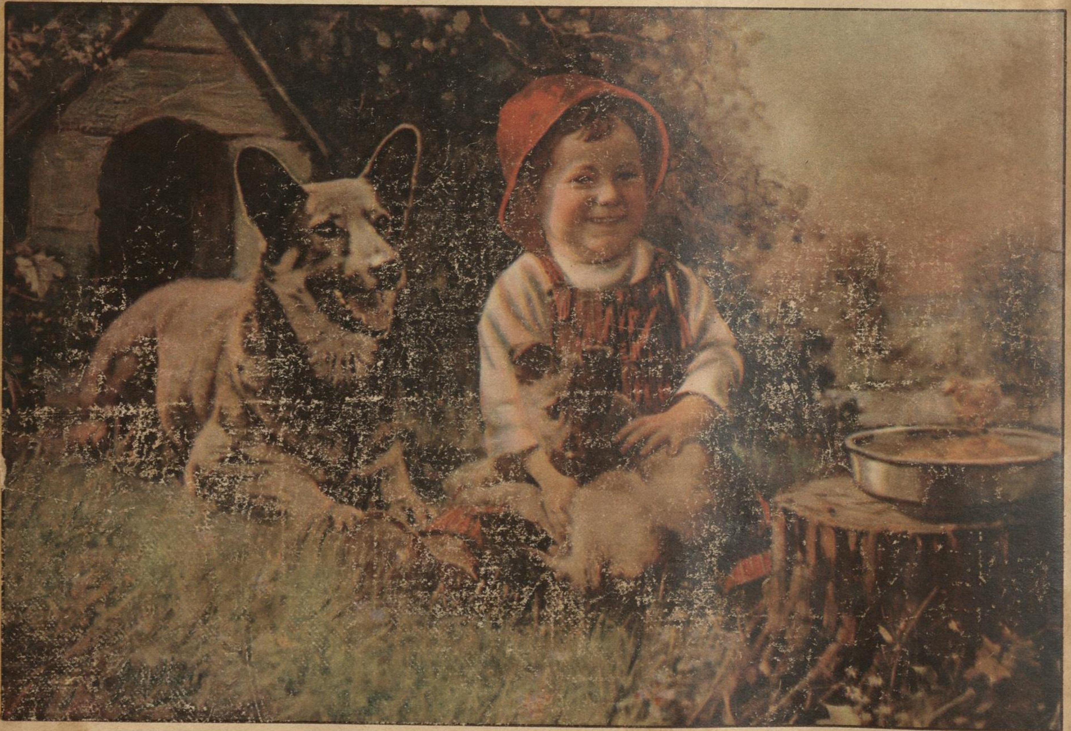
REUNION FAMILIAR, por Alfred Guillois.