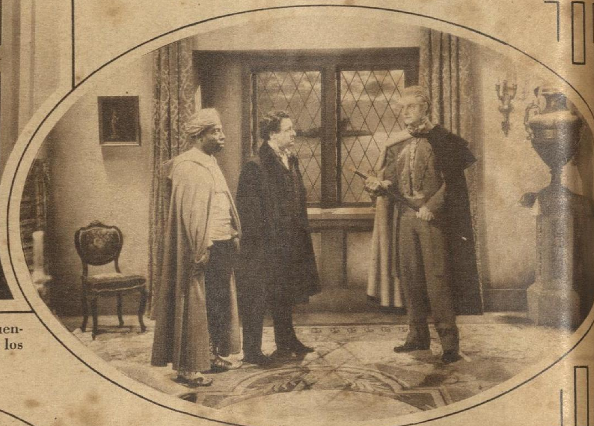
EL CONDE DE MONTE CRISTO EN CINE: La inmortal obra de Alejandro Dumas ha sido interpretada una vez más para la pantalla por el actor inglés Robert Donat como protagonista.