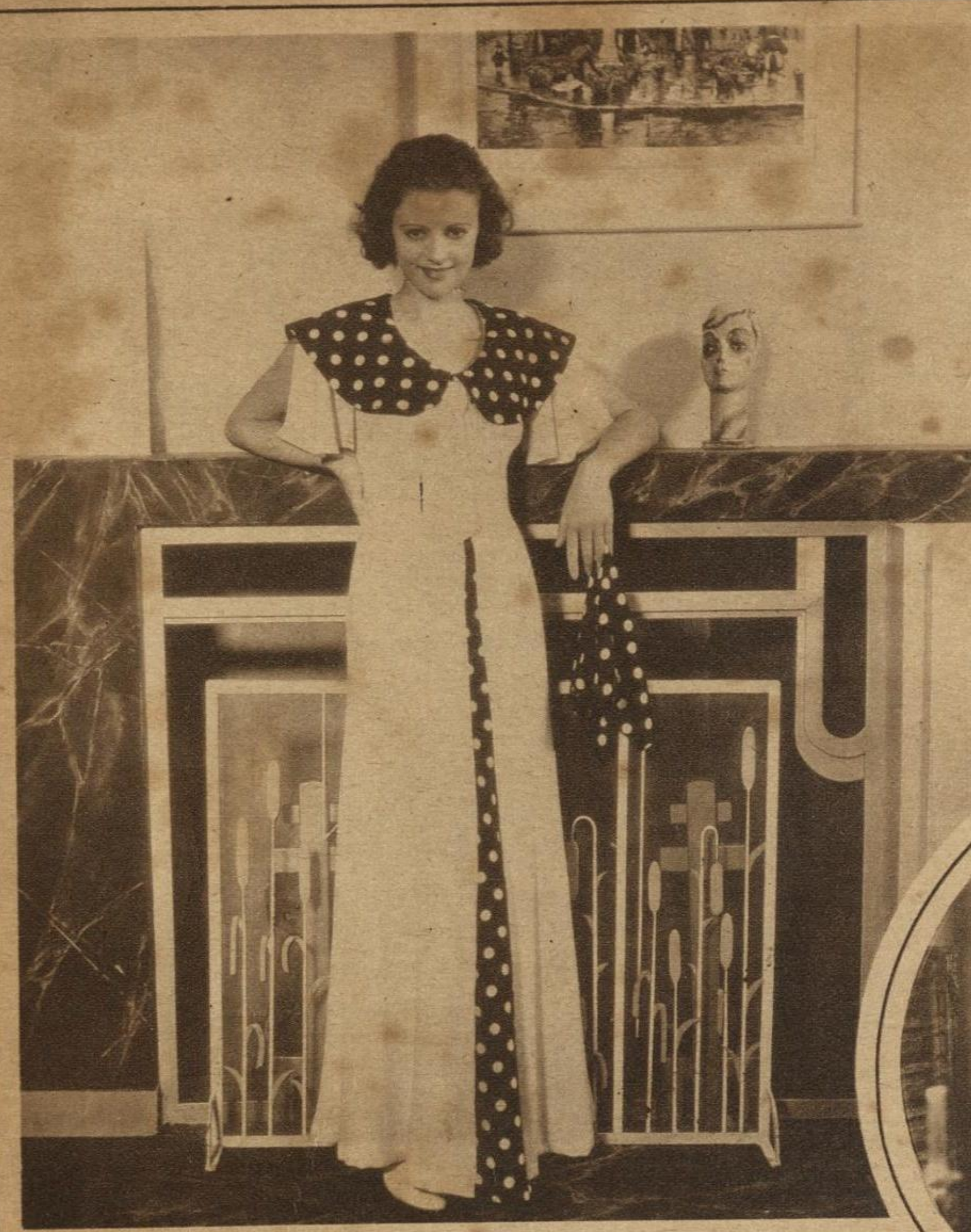
HEATHER ANGEL, de la Fox, es una artista cuyos éxitos se cuentan por sus apariciones en la pantalla, y con razón, porque tiene los tres grandes elementos: juventud, hermosura y talento.