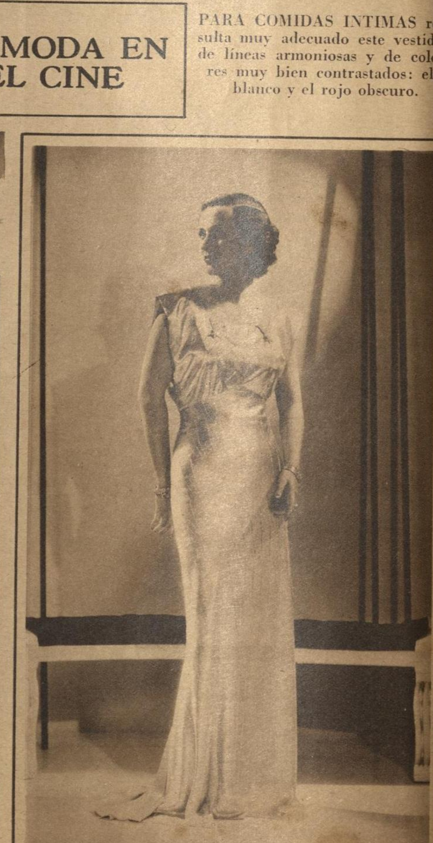
EL COLOR ROSA PALIDO de este vestido de fiesta, de corte sencillo y elegante, adquiere relieve al contrastar con las líneas metálicas del bordado y con las piedras de los adornos en los ángulos formados por el escote.