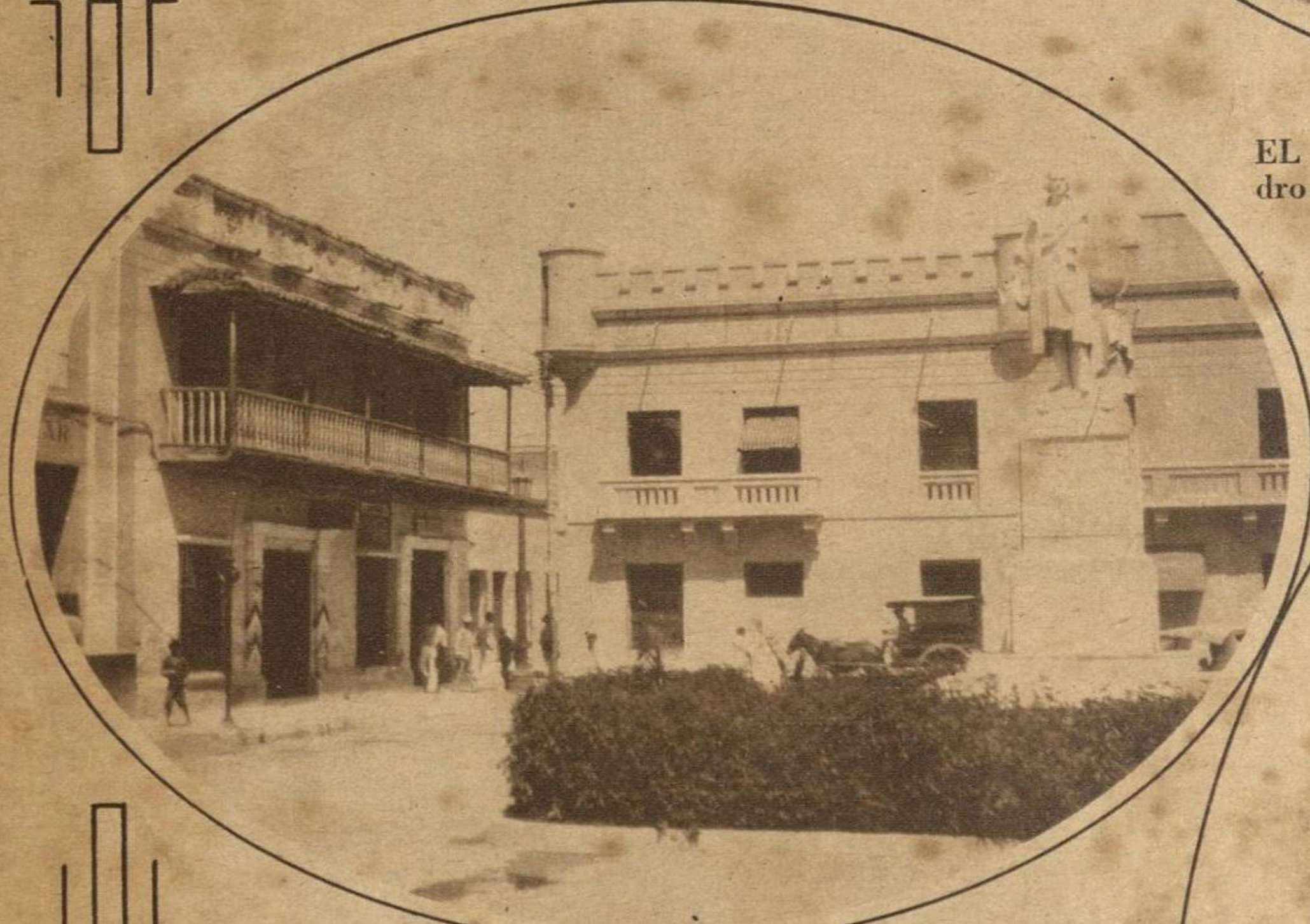
LO ANTIGUO Y LO MODERNO se confunden en Barranquilla, Colombia, como lo prueba esta fotografía, en la cual se ven un cuartel militar, la estatua de Colón y una casa de la época colonial.