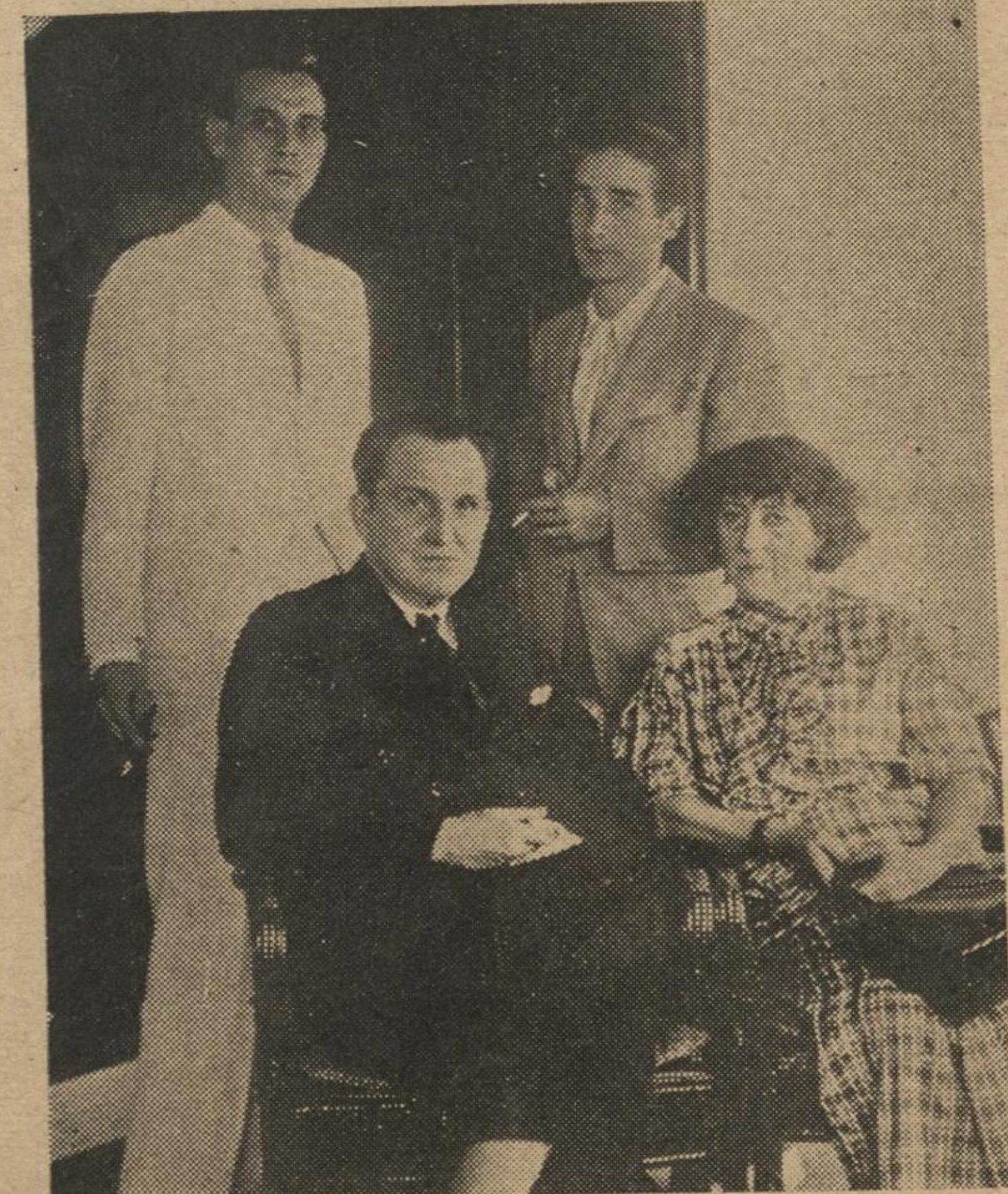
Una visita de alta significación en nuestra vida intelectual, ha sido la de la eminente novelista española Concha Espina, quien llegó a Guayaquil en jira a través de los países ibero-americanos. Poetas, escritores y mas elementos intelectuales se dieron cita en el momento del arribo para testimoniar a la connotada literata su estimación espiritual y simpatía; y nuestras instituciones culturales le ofrecieron un agasajo, que fue cumplido homenaje a los invalorables merecimientos de la señora Espina.

Varias distinguidas damas del ambiente social porteño y de las colonias americana e inglesa, residentes entre nosotros, pertenecientes al Country Club de Guayaquil, han formado un Comité con el objeto de ofrecer mañana domingo un Té Bailable, en los salones del mencionado centro social deportivo, con el objeto de inaugurar la temporada social de invierno y a la vez levantar fondos para el establecimiento en el local social de varias secciones para mujeres, como peinadoras, toilets, etc., etc. Por los preparativos y entusiasmos que hasta ahora auspician esa próxima fiesta, podemos augurarle un éxito completo. Las damas organizadoras piensan, con todo empeño, ofrecer una fiesta digna de las muchas realizadas en el año pasado en los mismos salones.