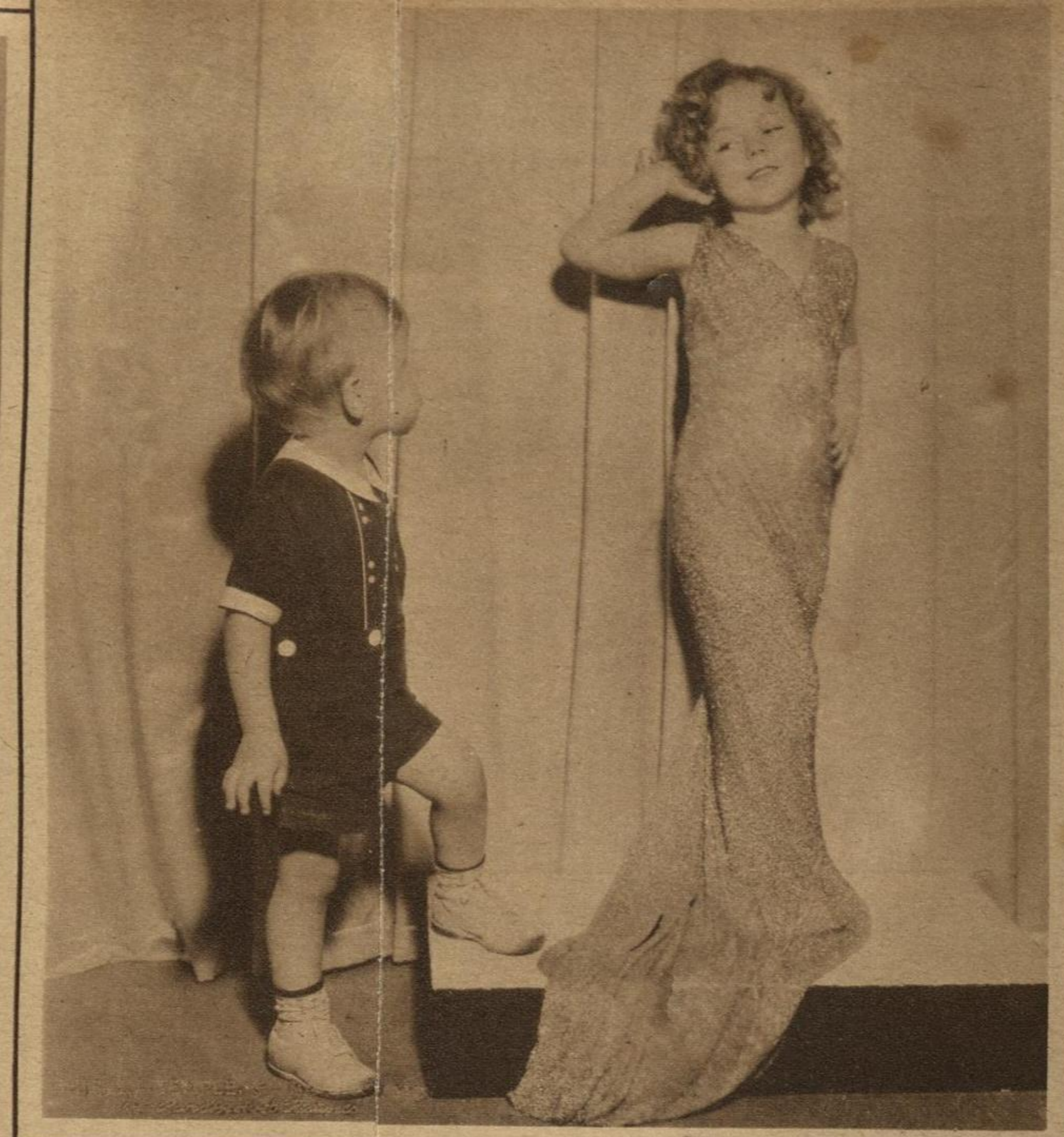
DOS MINUSCULAS "ESTRELLAS" de la Paramount, son Shirley Temple y Baby Le Roy a quienes la cámara sorprendió en este cuadro plástico que hace presentir lo que será Shirley con el tiempo: Ni Mae West!