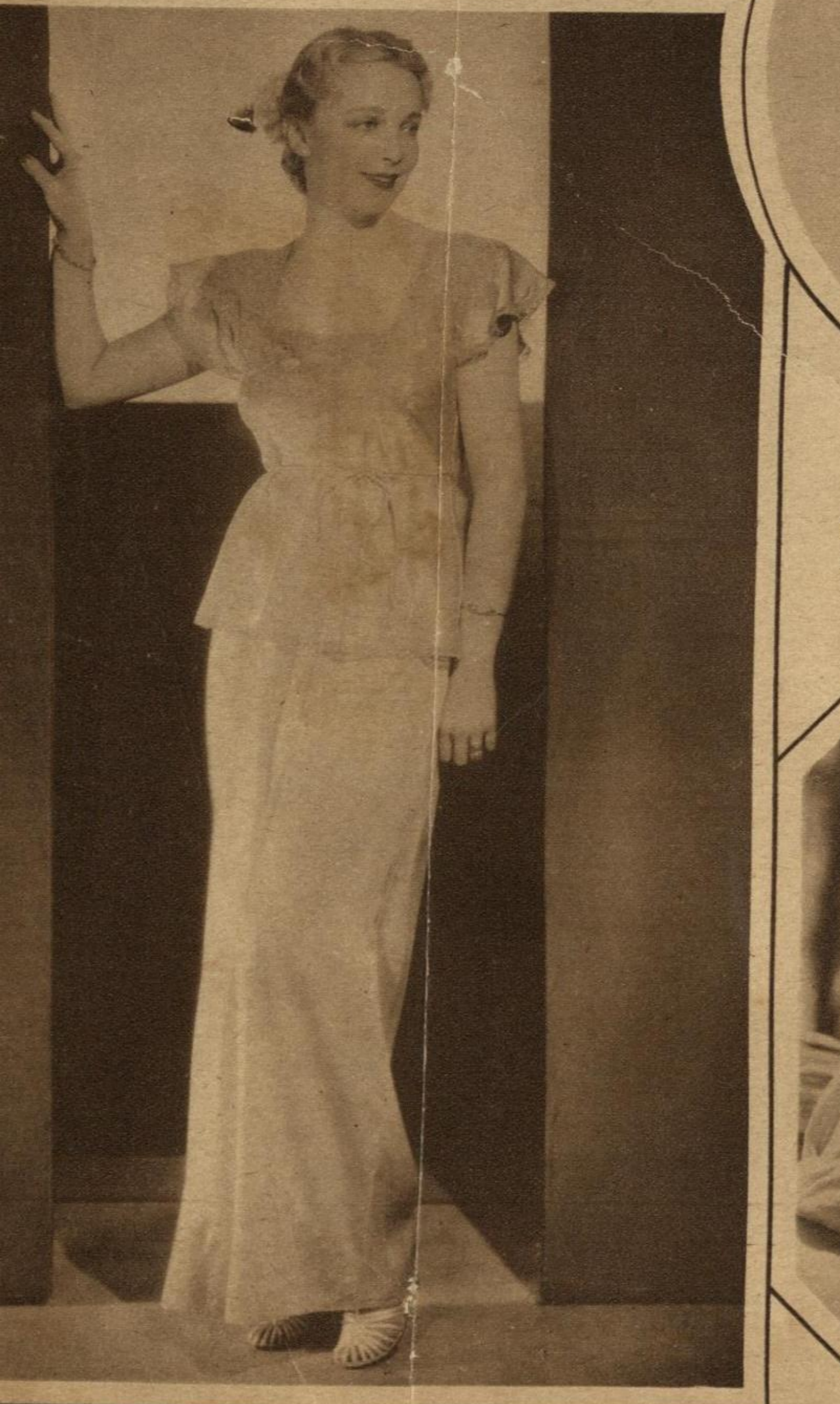
BRUCE, artista de la Metro-Goldwyn-Mayer, luce en esta elegante piyama de raso y encaje que le sienta admirablemente bien.