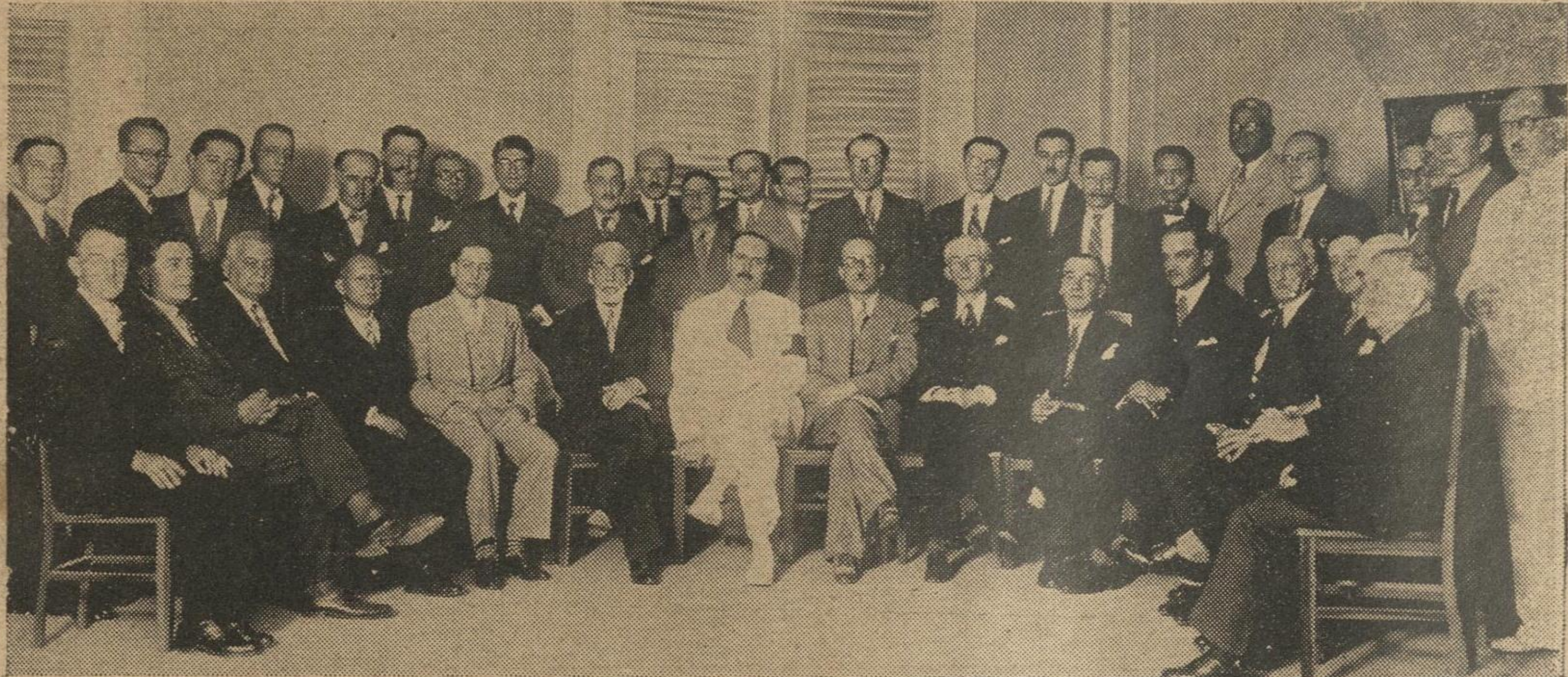
Extraordinaria resonancia ha tenido en el país la reunión de la Asamblea Liberal-Radical, cuyas sesiones han comenzado a realizarse en el salón de actos de la Universidad de Guayaquil. La presente fotografía fue tomada después del solemne acto inaugural; y en ella aparecen los delegados de las diferentes provincias de la república, al centro de los cuales se halla el doctor Carlos Arroyo del Río, quien fué elegido presidente de la Asamblea.