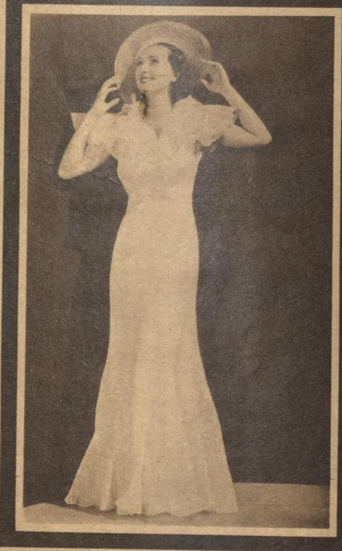
LA JUVENIL BELLEZA de la artista parece encontrar un marco adecuado en esta vaporosa creación, digna de ser copiada por las mujeres elegantes de las zonas tropicales.

PARA IR DE COMPRAS o simplemente de paseo, Margaret Lindsay prefiere conjuntos sencillos como el que aquí luce, demostrando una vez más que la sencillez no se encuentra reñida con la elegancia.