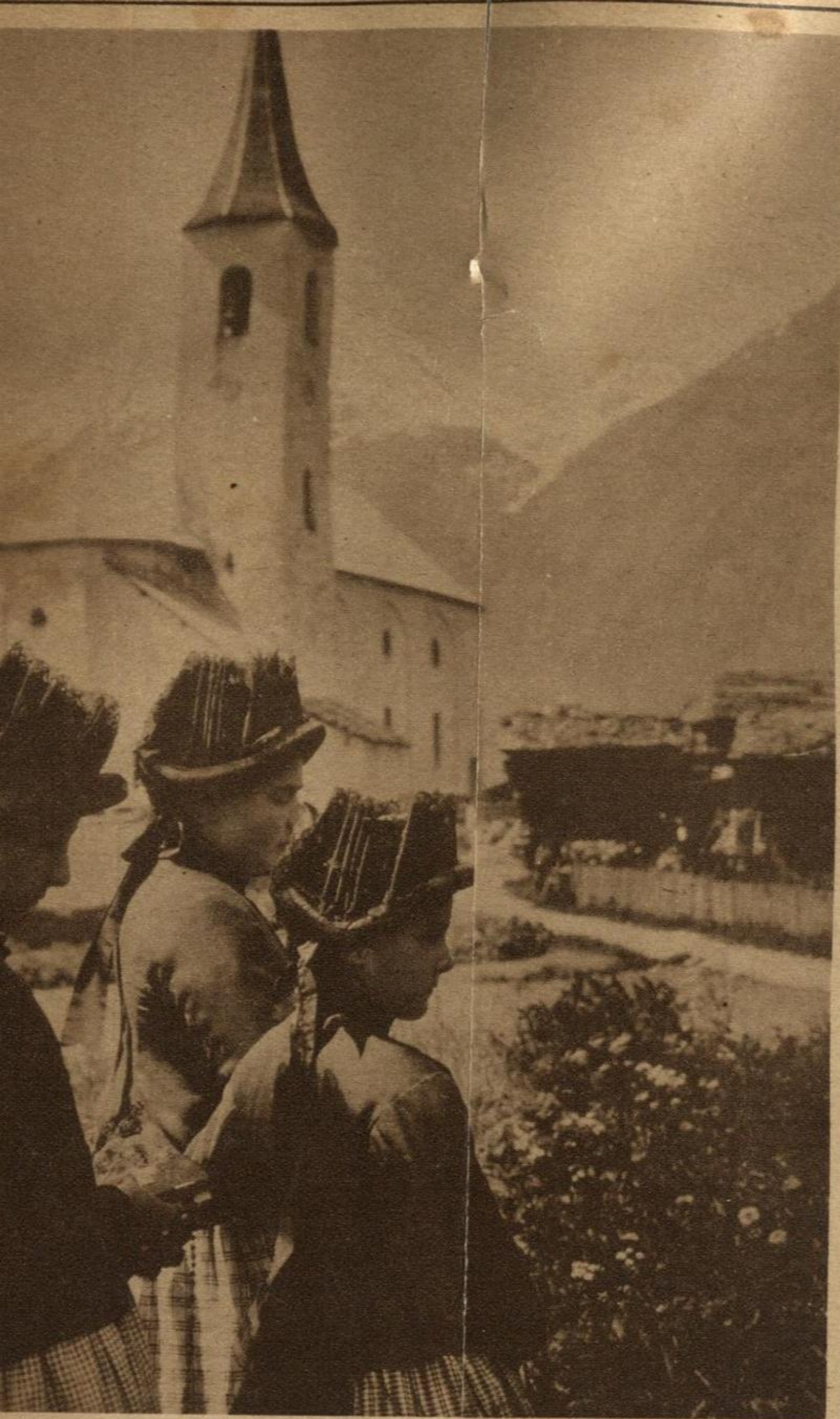
EL TIEMPO PARECE NO PASAR: En el pintoresco Otschen, Suiza, hasta los miembros de la joven generación continúan apegados a los usos y a la indumentaria de siglos pasados.