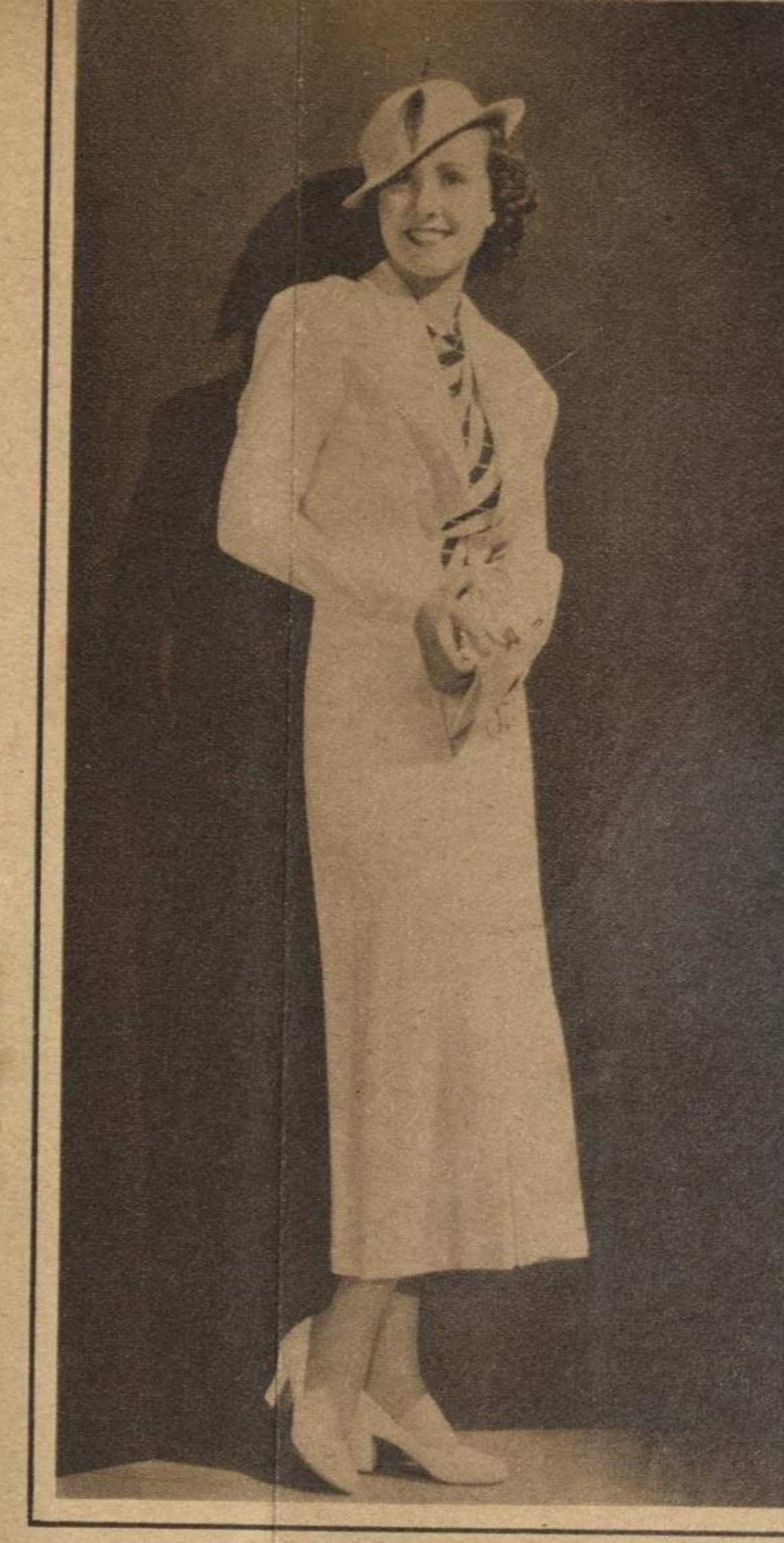
MARGARET LINDSAY, ESTRELLA de la Warner Brothers, es una de las artistas que se caracterizan por su buen gusto en el vestir, como puede apreciarse por las fotografías que figuran en esta plana.