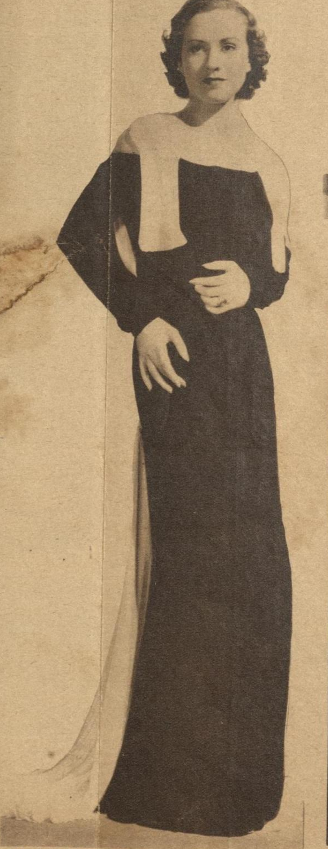
EN UNA RECEPCION O FIESTA de carácter íntimo habrá de ser apreciado este modelo, que es casi austero, pues todo su encanto consiste en los colores contrastados de las telas.