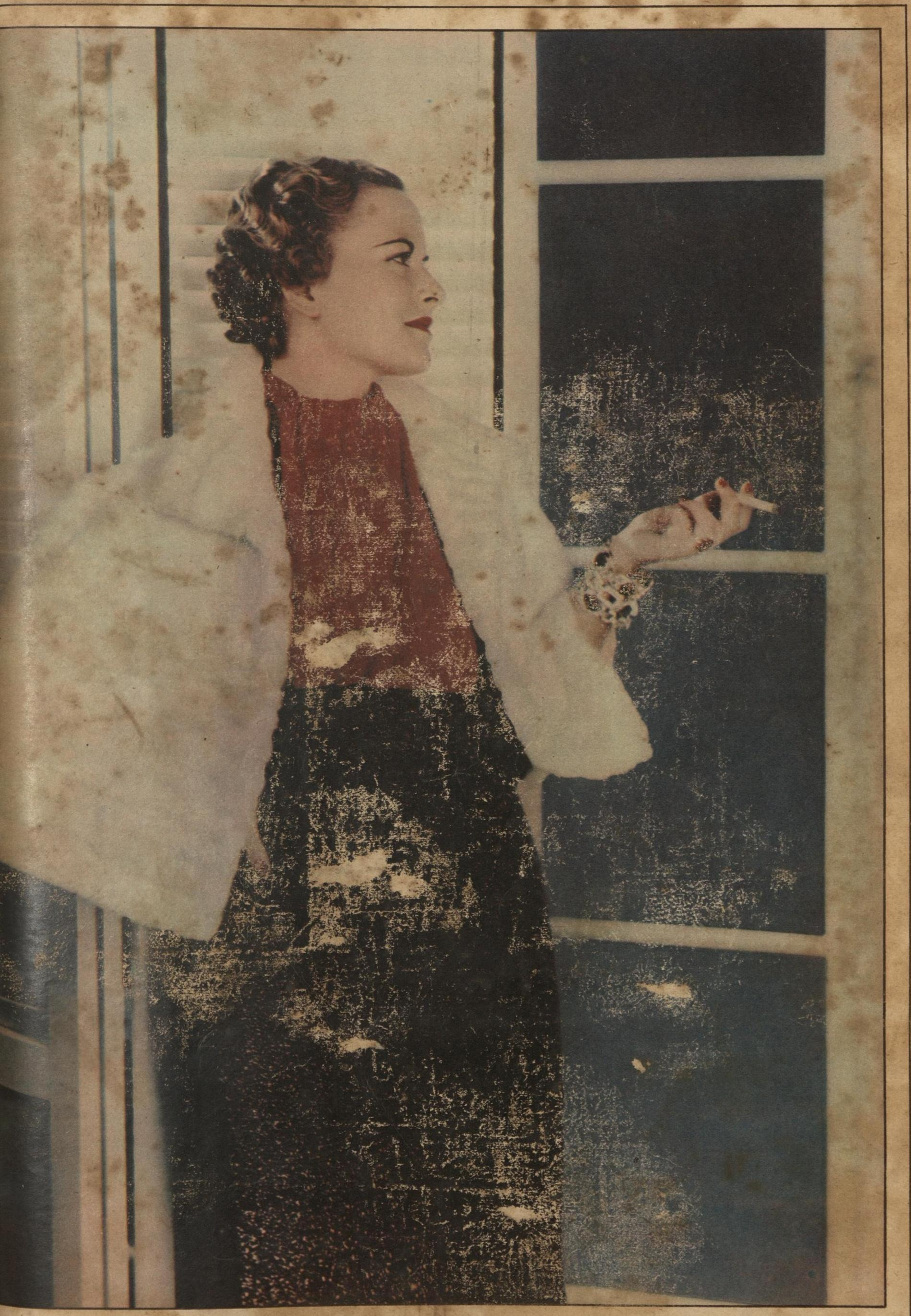
SALIENDO DEL BAILE. (Estudio cromográfico).