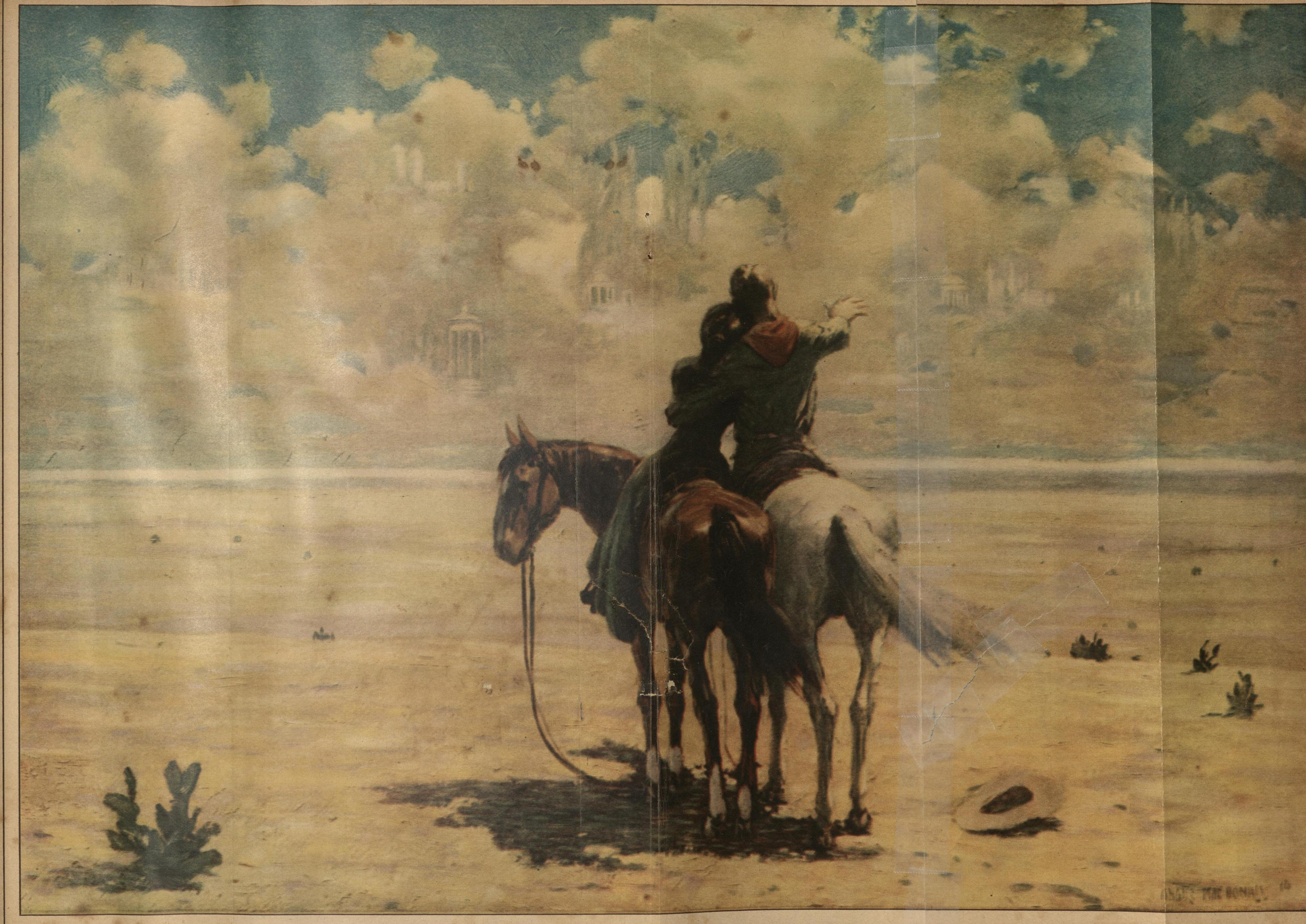
MIRAJES DE AMOR, por Angus McDonald.

Las telas nos invitan a la poesía, tal es el susurro encantador que ofrece a nuestros oídos, recordándonos la naturaleza donde hay cielo y mar.