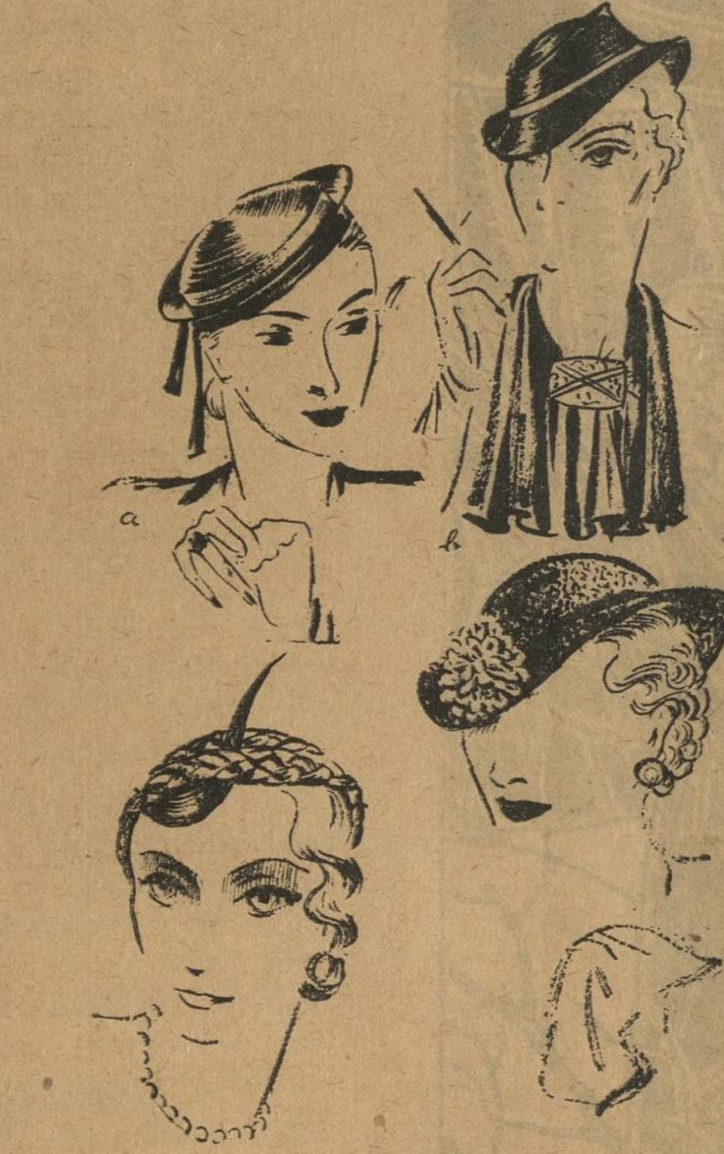
(A) Una pequesita gorra marinera de "picot" azul marino con banda y cinta de raso que cae por detrás. (B) Un pequeño y blando sombrero de antlope usado en combinación con una bufanda del mismo material. (C) Una toca de "pallaseen" de color negro y una pluma blanca que sale de debajo del sombrero sobre la frente. (D) "Pallaseen" fino de color negro es usado para este lindo modelo con una rosa como adorno en el ala.

La alpaca también se emplea para trajes de calle y algunos modelos para tarde, siendo también una tela que hace suave ruido al caminar. Los tules vaporesos, los organdies de seda y otras telas, mezclan en sus tejidos la hebra de plata, de cellophane o lentejuelas para darle más cuerpo y así los pliegues o rizados quedarán más duros, como sucedía antiguamente con los brocados y otras telas con que se confeccionaba el malakoff.