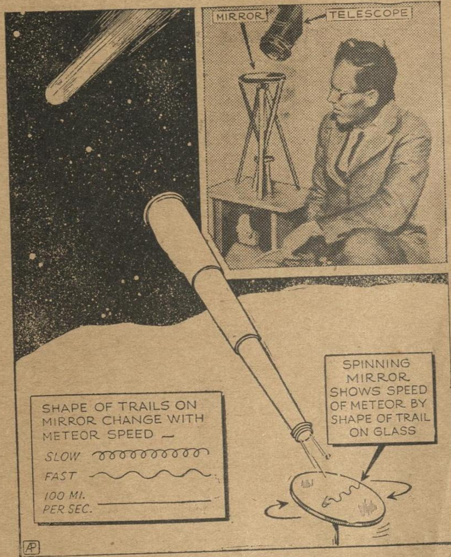
Los hombres de ciencia no cesan en su afán de descubrir los misterios del Cosmos, sorprendiendo sobre el espacio las leyes que rigen las relaciones de los astros. Nuevos procedimientos han sido adoptados en los observatorios astronómicos; y la presente gráfica muestra cómo con espejos colocados sobre un trípode y un telescopio, los científicos están midiendo la velocidad de los meteoros y poniendo en evidencia otros secretos del éter.

Nuestra insignificancia Conozcamos ahora a nuestros vecinos más importantes: La estrella más próxima a nosotros, es el "alfa centauri" que está a cuatro años de luz de nuestros ojos. La "estrella polar" está separada de nuestra Tierra, por "cuarenta años luz". En el año 1916 el método para medir las distancias interestelares fué simplificado merced a un nuevo procedimiento descubierto por el astrónomo americano Walter Adams, gracias a la aplicación del espectroscopio. Así, debido a este método, hemos