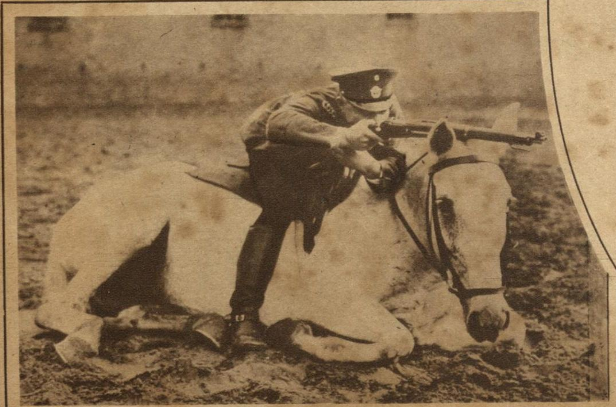
LOS CABALLOS SON INTELIGENTES, y a quien lo dude le bastará examinar esta fotografía de un corcel de guerra sorprendido por la cámara durante las operaciones de la batalla de San José, la capital costarricense.