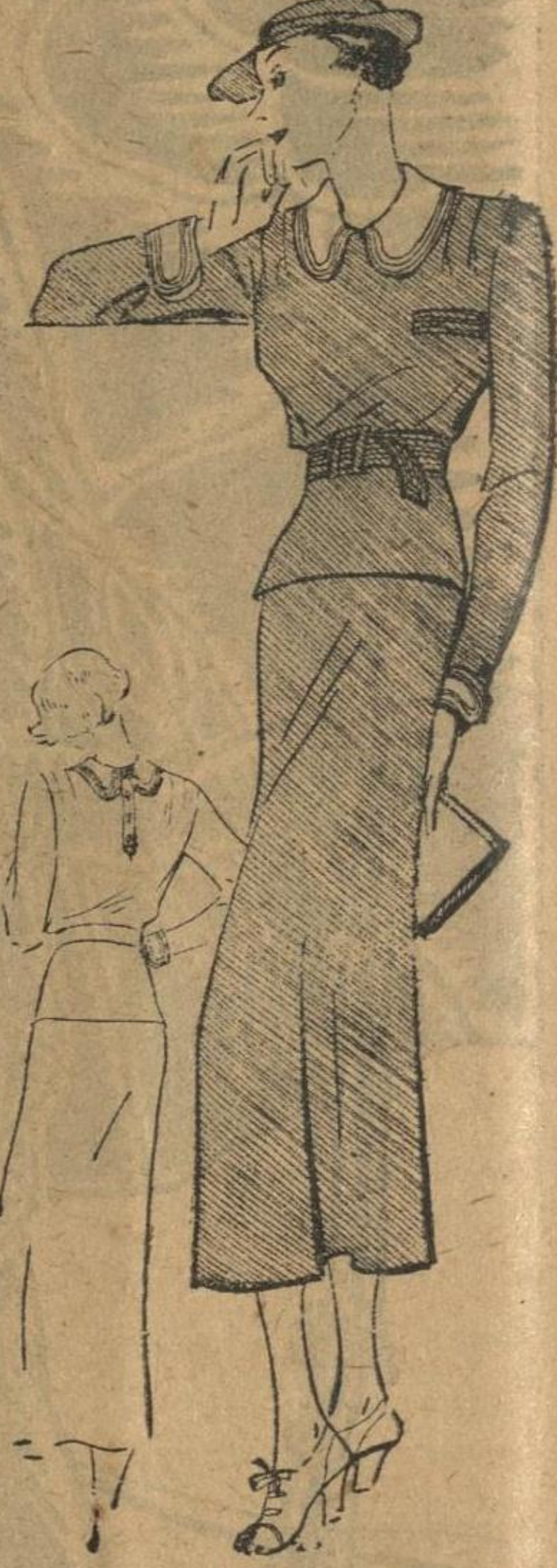
Este modelo de vestido de dos piezas de "jersey" al pastel con cuello y puños de lino, revive un modelo que fue muy popular hace algunos años.

Los detalles elegantes que se usan con ensambles son los guantes de gamuza natural y los sombreros de paja de Italia que se ven acompañando a los trajes sencillos. Hay infinidad de efectos en ruches, vuelos, tufos y petos para adornar la V de las chaquetas, siendo éstos de organdi piqué y tafetán blanco de seda o tul en forma de petos, baberos, giletas y grandes corbatas.