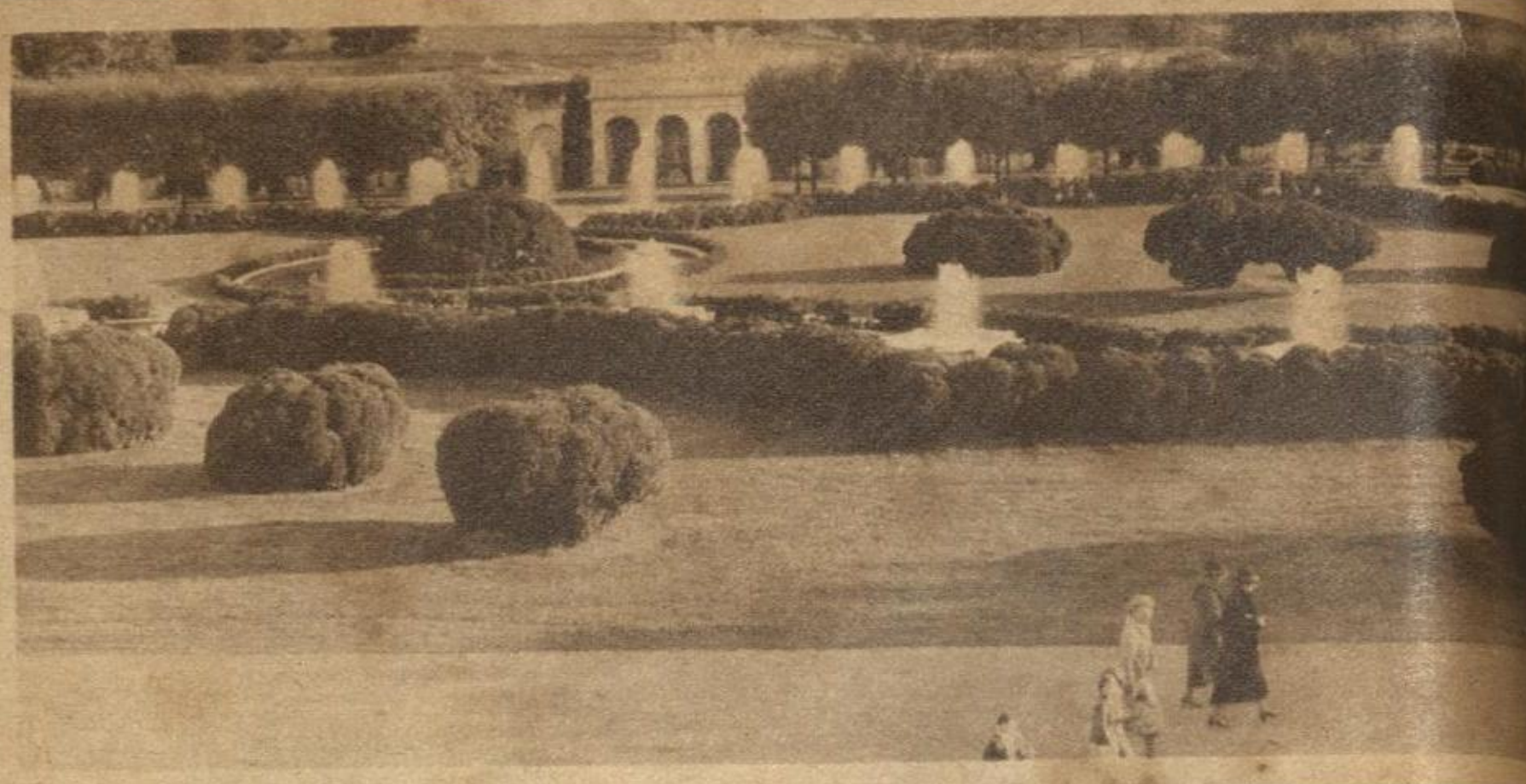
¡ASI VALE LA PENA VIVIR! Los jardines de la suntuosa residencia multimillonario americano Pierre DuPont, fabricante de explosivos, en Wood Gardens, Pennsylvania.