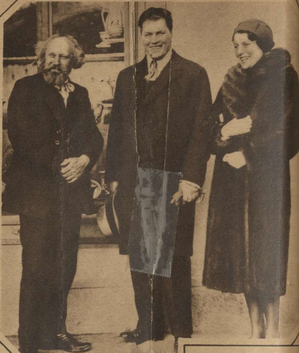
GENE TUNNEY, ex-campeón de boxeo y su esposa visitaron a Anton Lang, que representó el papel de Cristo en la célebre representación de la Pasión, de Oberammergau, Alemania.