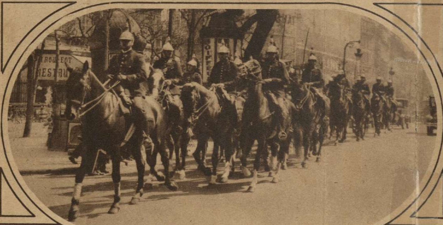
UNA PATRULLA DE LA GUARDIA REPUBLICANA EN PARIS.—Debido a la tensión política que reinó en París hace poco, pudo verse con frecuencia este inusitado espectáculo.