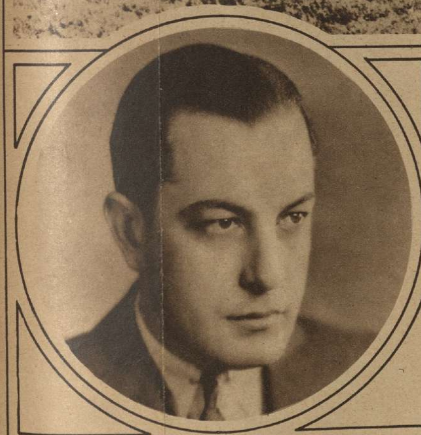
JUAN TORENA, uno de los pocos actores hispanos que sobresalió en el desastre ocurrido a todos los intentos de cine parlante hechos en Estados Unidos.