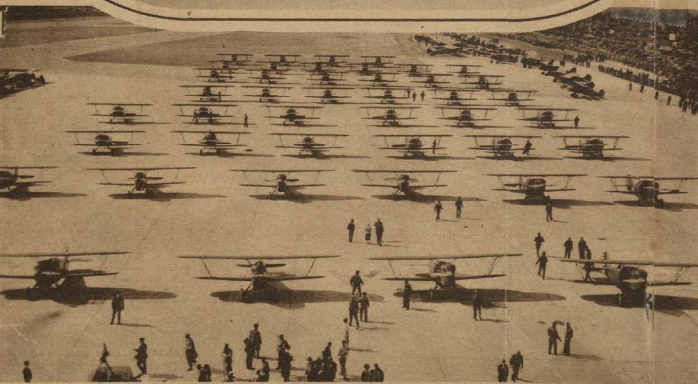
Un pequeño grupo de aviones del gobierno Norteamericano, reunido en el campo de aviación de Detroit, durante las maniobras en las cuales tomaron parte 674 aparatos.