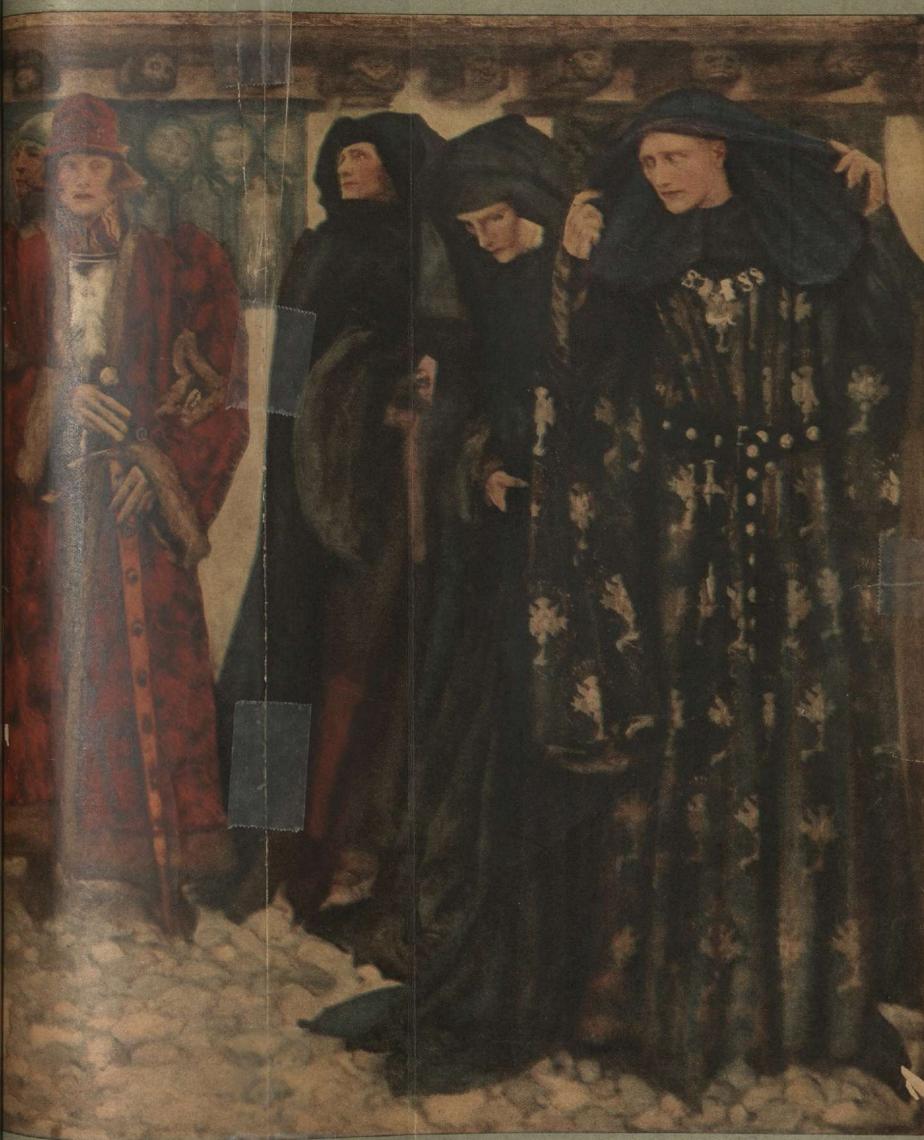
Este cuadro lleno de colorido e interés, describe un episodio de la vida de Leonor, condenada al último suplicio por haber sido feladamente... por Edwin Austin Abbey. Worcester, según el conocido drama de Shakespeare, "El Rey Enrique VI." Leonor fue... entra her...