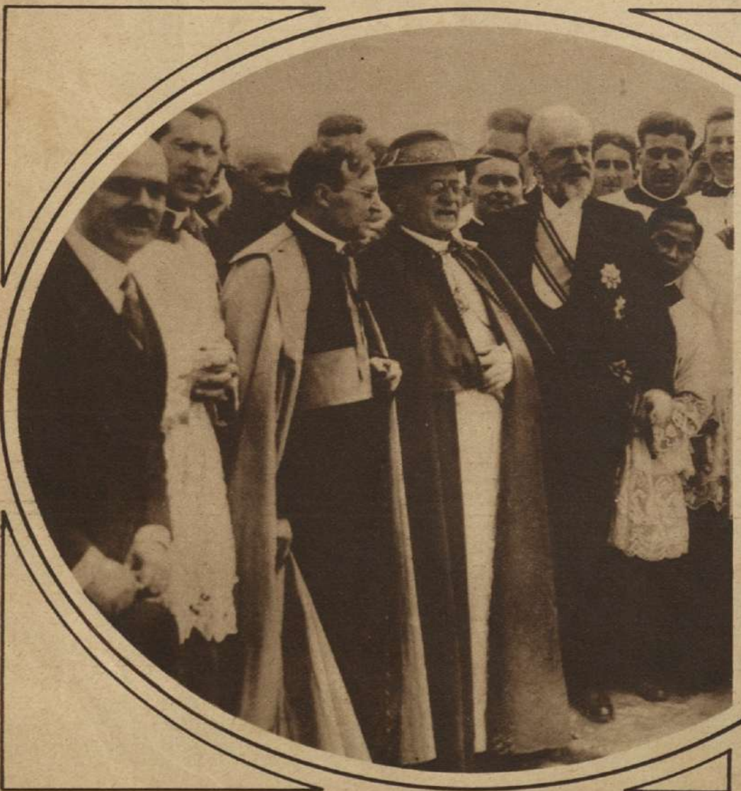
S. S. EL PAPA , continúa abandonando su tradicional retiro del Vaticano para concurrir a diversas ceremonias. Helo aquí presenciando la inauguración de un colegio católico en la colina Janicula, en Roma.