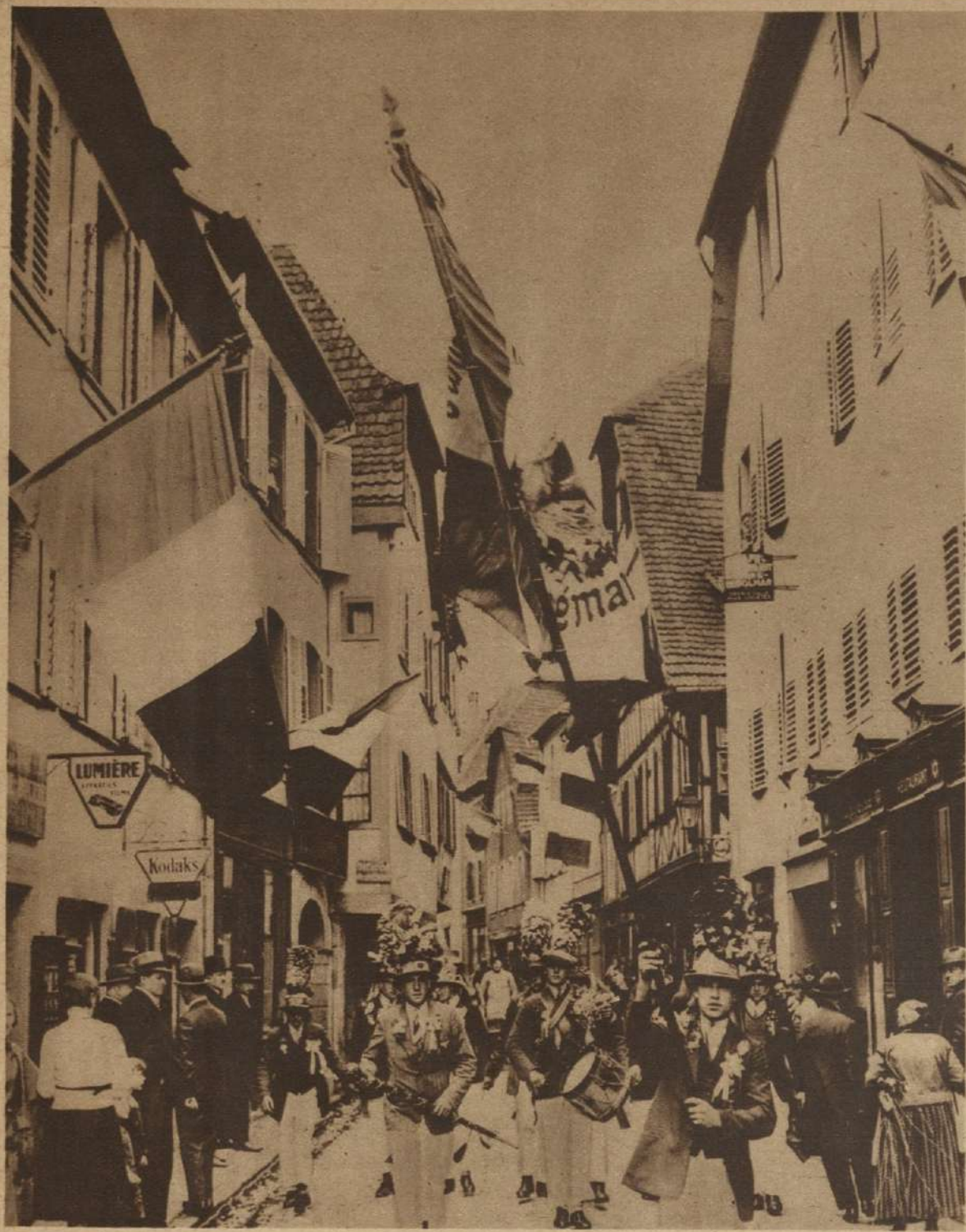
EL ESPEJISMO DE LAS ARMAS. —A pesar de las prédicas pacifistas el entusiasmo militar no parece decaer en Francia, donde al ser llamados al servicio los reclutas, celebran el acontecimiento con gran alborozo.