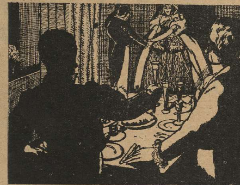
...echándose atrás la capucha, dejó ver un rostro hermosísimo de mujer: era la Reina María Luisa que...

Lo atractivo de esta aventura no logró, sin embargo, apartar al joven Bolívar de los afanes de sus estudios, y por lo contrario, un incidente ingrato en que se vio envuelto por una intriguilla palaciega, lo indujo a buscar en el hogar la realización de sus