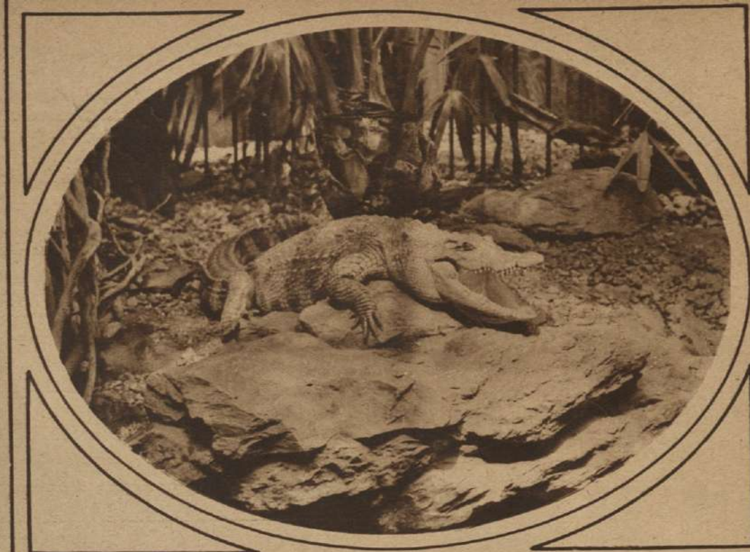
LA SONRISA DE UN COCODRILO, podría llamarse esta fotografía tomada en el Jardín Zoológico de Berlín.