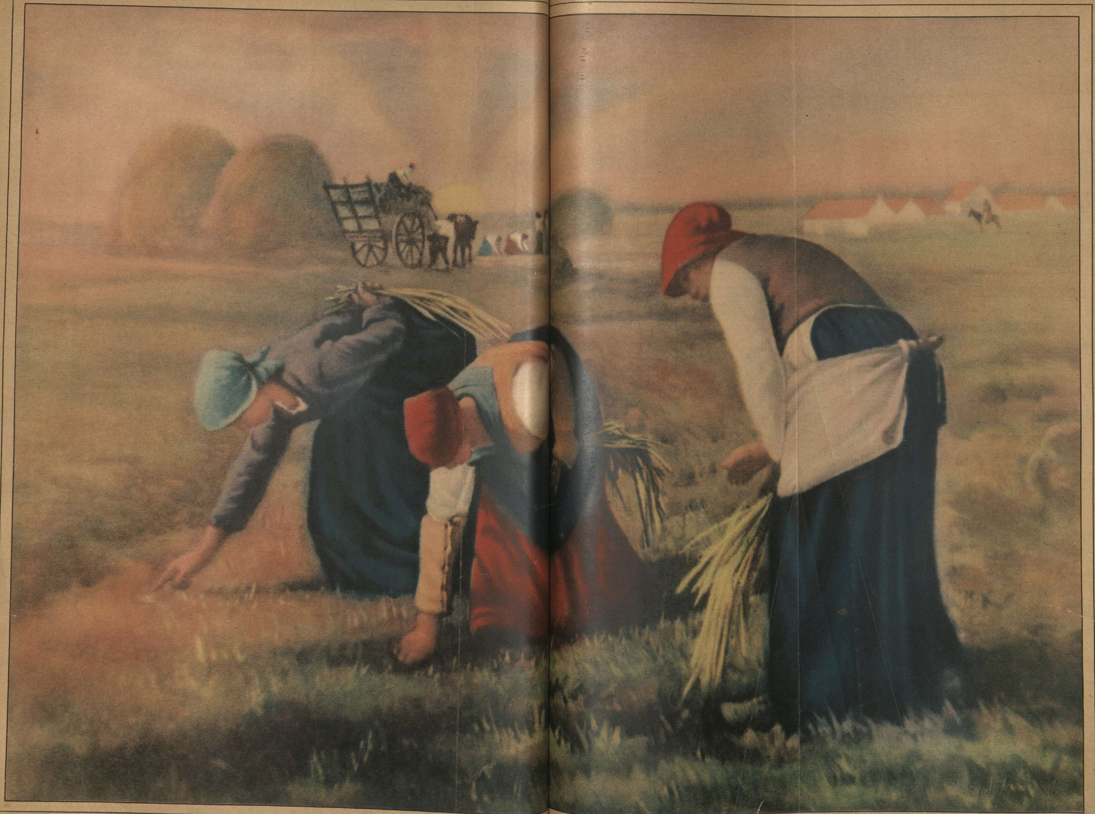
Terminada la cosecha, las espigadoras recorren los campos en busca de los granos que el viento ha llevado a los alrededores. Este cuadro, pintado por Millet en 1874, representa una de las escenas más típicas de la vida campesina en el campo de su patria, el Normandía. En el fondo se ven los montes de paja y el carro que transporta el grano. Las espigadoras, vestidas con sus tradicionales vestidos azules y rojos, se inclinan sobre el campo para recoger los granos que el viento ha llevado a los alrededores. Este cuadro, pintado por Millet en 1874, representa una de las escenas más típicas de la vida campesina en el campo de su patria, el Normandía.