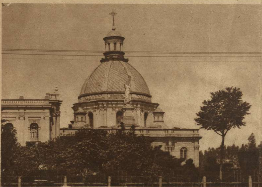
RIOBAMBA (Ecuador).—Cúpula de la Basílica del Sagrado Corazón.