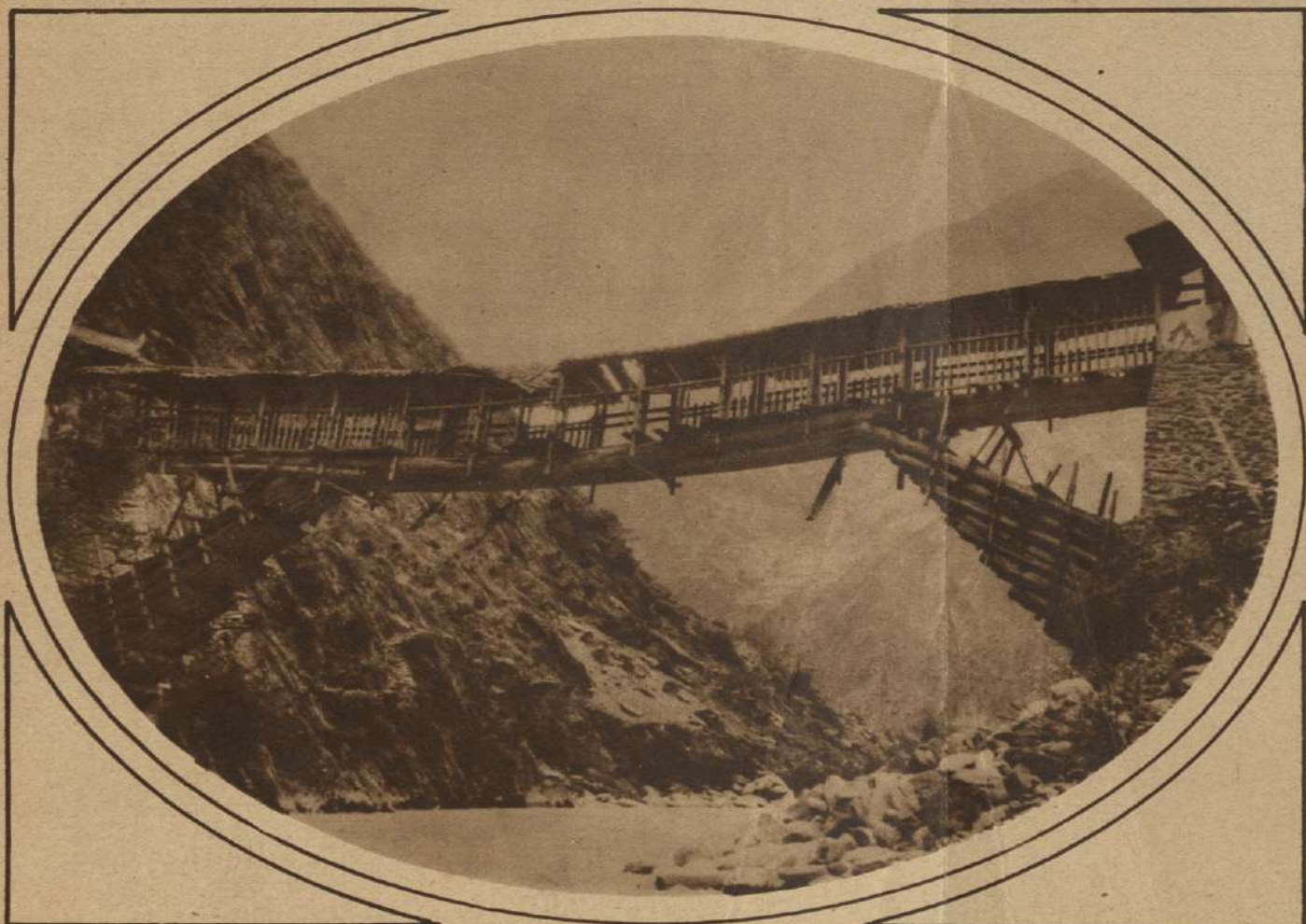
EN EL CORAZON DEL ASIA.—Puente colgante sobre el río Amur, fotografiado por el explorador Sven Hedin. Nótese el rudimentario sistema de sostenes laterales.