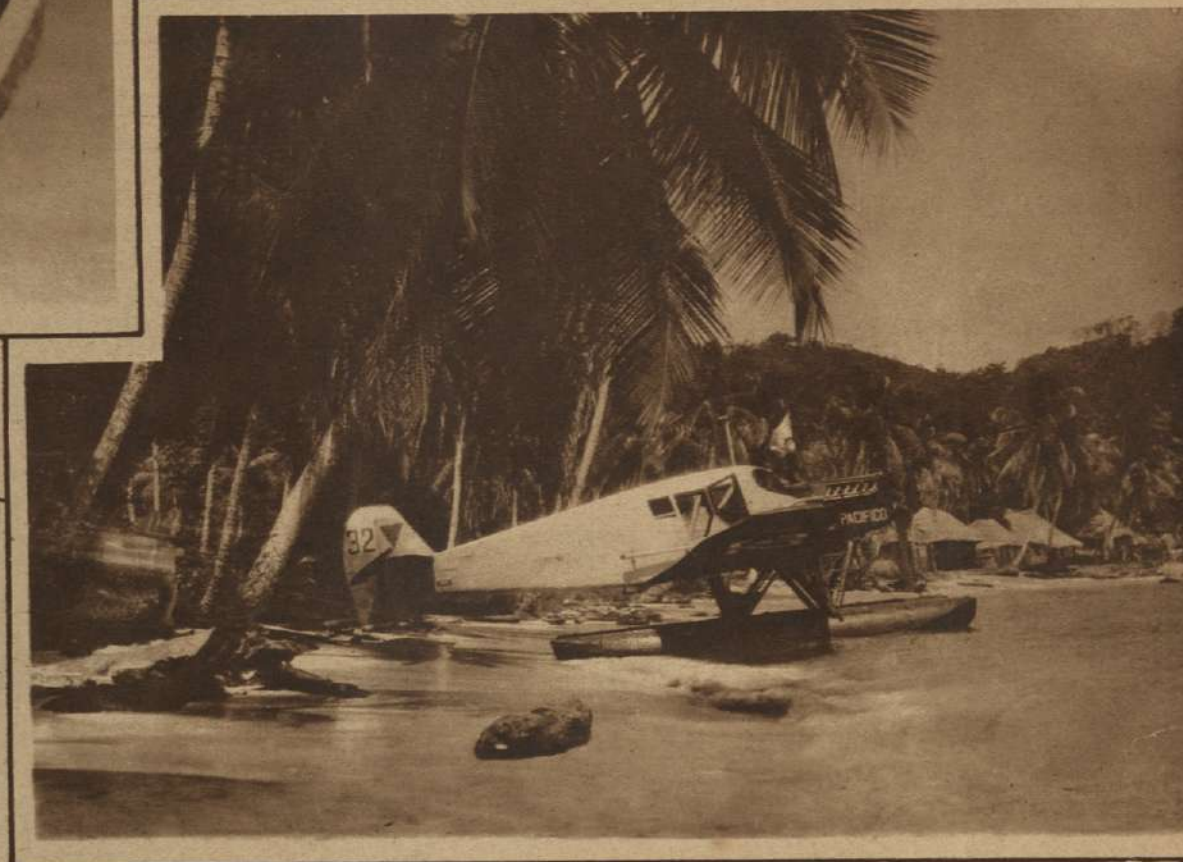
LA INVASION DEL PROGRESO.—Un hidroavión de la compañía Scadta, en Colombia, descansando en el Chocó. Al fondo, cabañas primitivas de los habitantes que parecen un anacronismo junto a la máquina moderna.