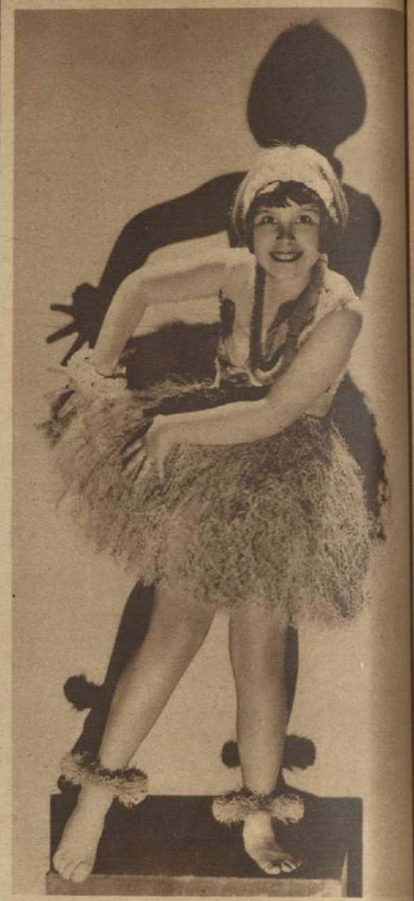
MITZI GREEN ha pasado ya a representar papeles más serios.