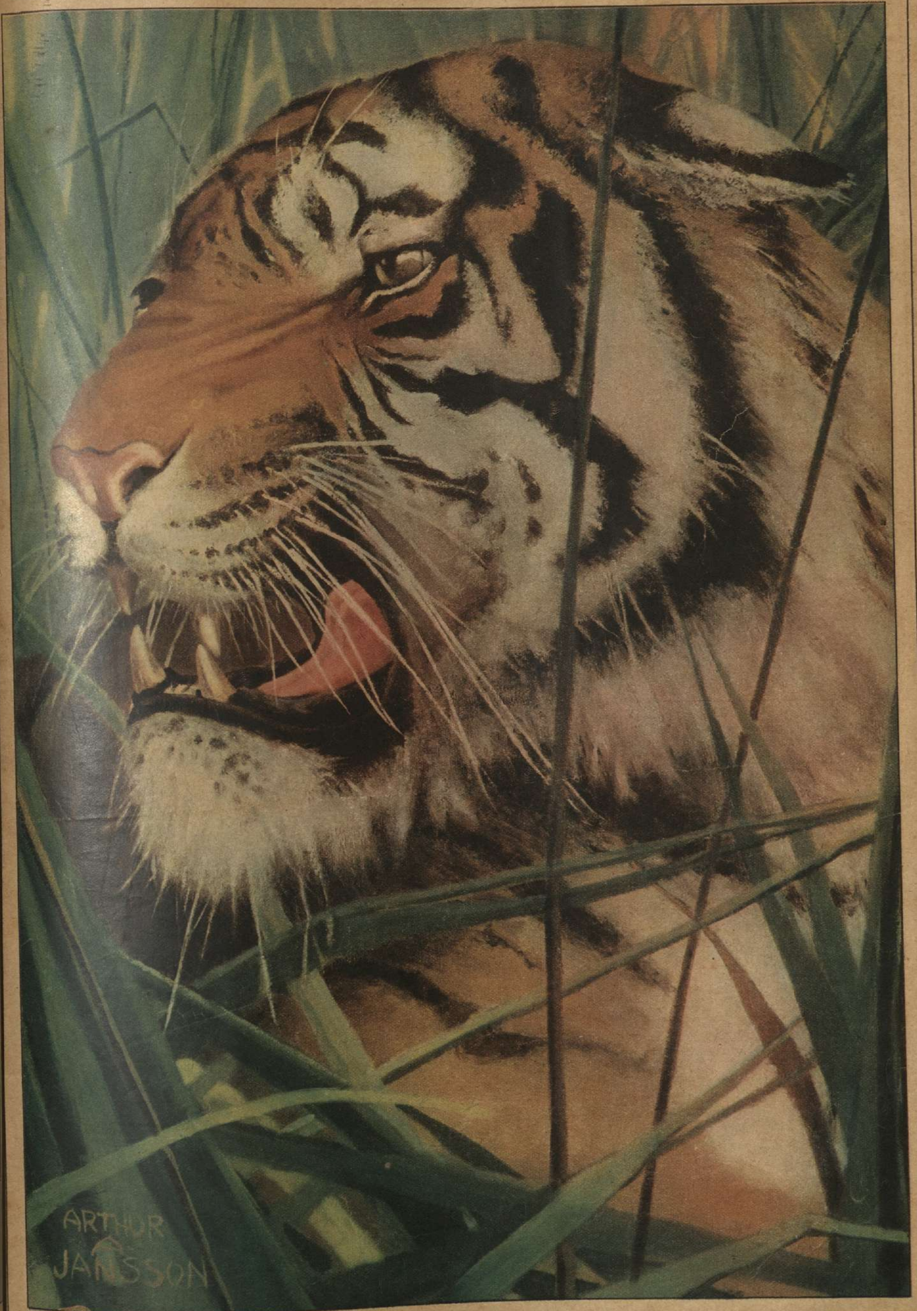
TIGRE, por Arturo Jansson.

La bárbara majestad del tigre, considerado por muchos expertos como el verdadero 'Rey de los Animales, ha servido al pintor para un lienzo impresionante.