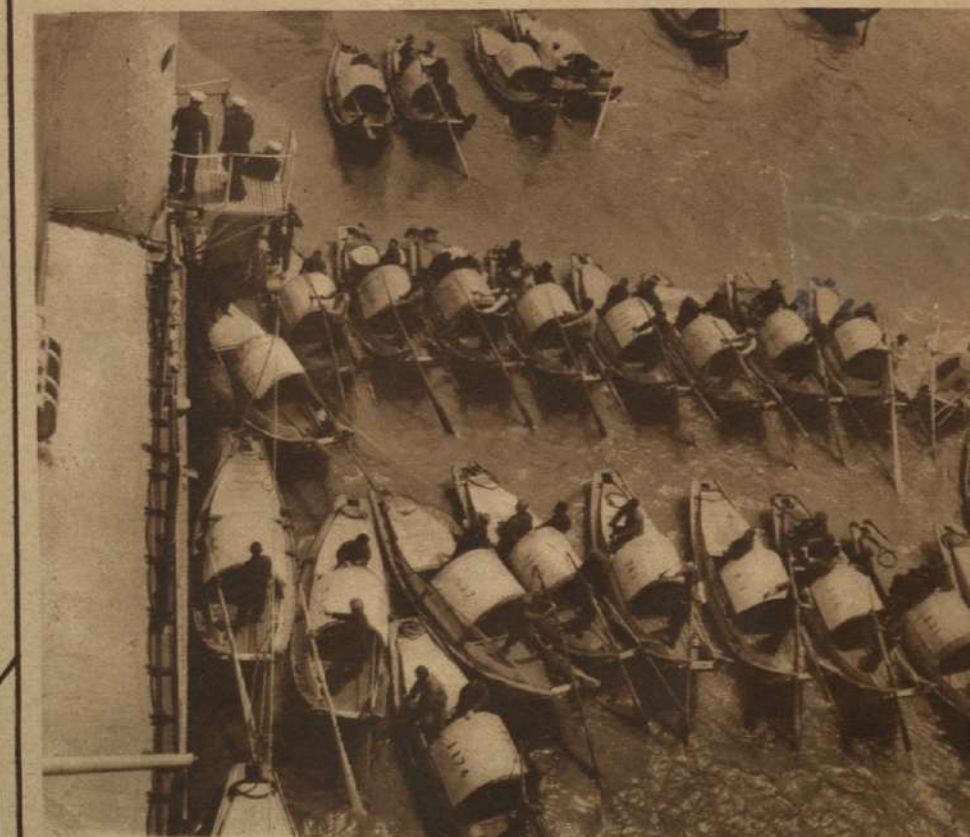
UNA LAVANDERIA FLOTANTE.—Curiosa vista de los juncos chinos llevando la ropa limpia a un barco de guerra europeo anclado en Shangai. A pesar de su número, nunca ocurre una confusión.