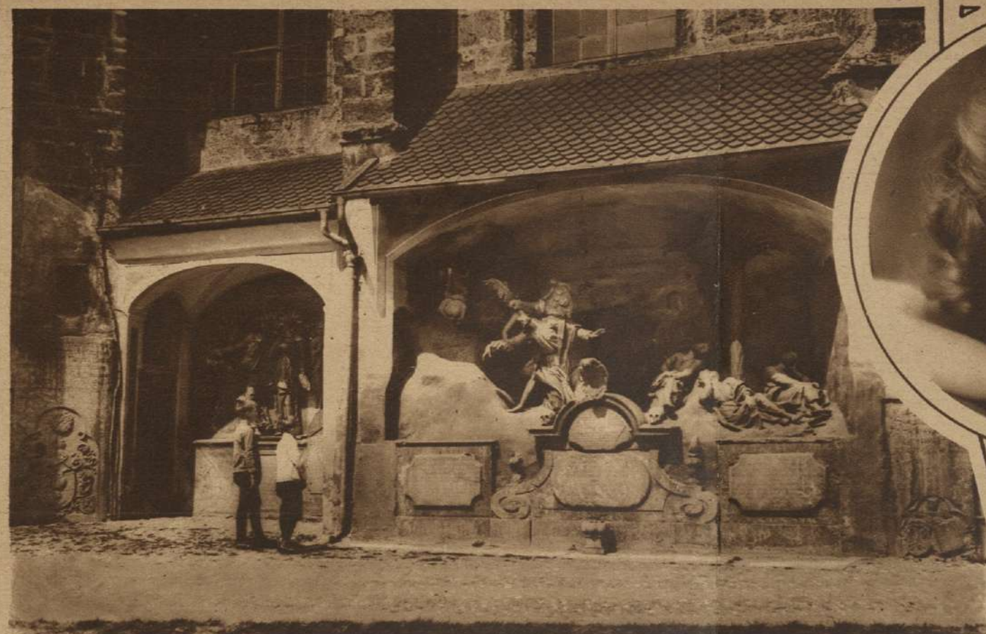
EN LAS PEQUEAS VILLAS DEL RHIN ALEMAN suelen verse maravillas arquitectónicas poco conocidas. He aquí un bajo relieve de la catedral de Tittmoning, en la Baviera Superior, mostrando una escena de la Vida de Cristo.