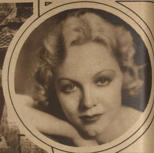
CLAIRE DODD abandonó el teatro para trabajar en películas parlantes.